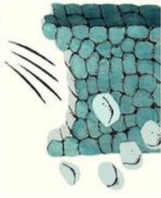
viel door de wind naar beneden.